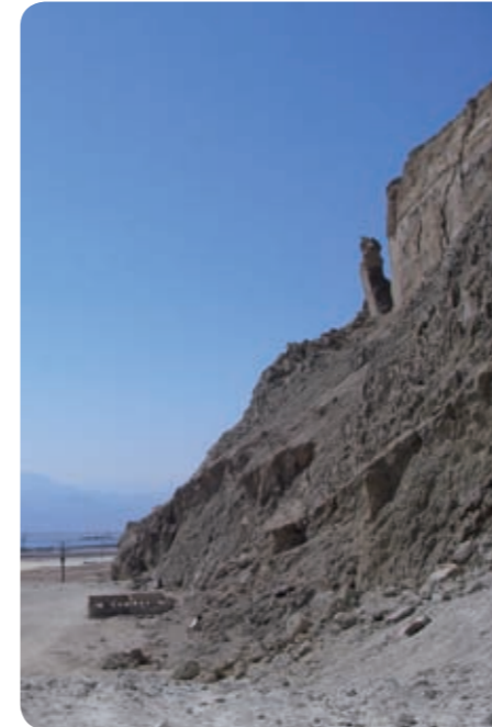
אשת לוט (מימין למעלה) מעל אכסניית סדום שנבנתה ממלח

כתב: עמוס פרומקין, המחלקה לגיאוגרפיה, האוניברסיטה העברית בירושלים