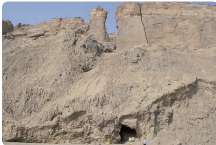
מתח מערת סדום מתחת לאשת לוט