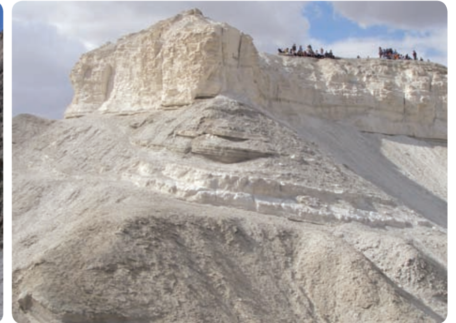
הגבעה הלבנה - תצורת הלשון

נחקרה ומופתה על ידי המרכז לחקר מערות, שאף מדד את גילה (כ־4,000 שנה), קצב התחזרותה וקצב התרוממות סלע המלח בתוך המערה (כתשעה מ"מ בשנה). בהמשך השביל מגיעים לפיר נטוש שבעבר נבלעו בו מימי ערוץ הדגים וזרמו למערה. בקירות הפיר - מחשופי סלע מלח מחורצים על ידי מי הגשם.