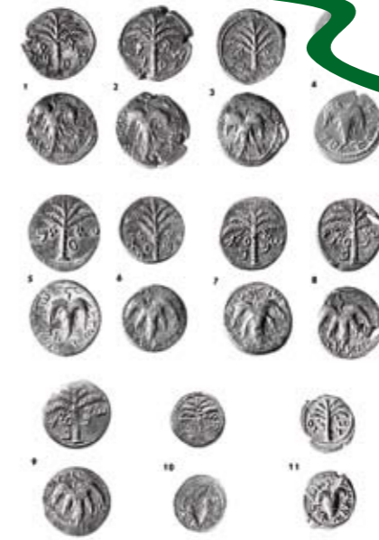
מטבעות מרד בר כוכבא.