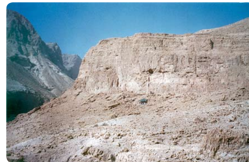
פתח מערת הר ישי מעל בית הספר שדה עין גדי.

מכיוון שכך, ולאור קרבת המערה למרחב המיושב של נאת עין גדי, לא ציפינו לגדולות ולנצורות באותו בוקר, עת התמקמנו מעל למערה והתחלנו לפרוס את חבלי הגלישה. פתח המערה פעור במצוק אנכי, נמוך כ-15 מטרים מראשו וגבוה כעשרה מטרים מבסיסו, ללא אפשרות, היום כבעבר, להגיע אליה ללא אמצעי עזר. יורדים ומתחילים בשגרת העבודה. קודם כל, בדיקה ראשונית של מתאר המערה וקרקעיתה. הבדיקה מאכזבת משהו. מתברר שמדובר במערה קטנטנה, אורכה הכולל רק שמונה מטרים והיא בנויה משתי זרועות קצרות המתפצלות ממרחב הכניסה הקטן. נוסף על כך, אי אפשר להתקדם בה אלא בשפיפה, ונראה שהיא אינה נוחה בעליל לפעילות אדם. עם זאת, הקרקעית מעידה כי בבירור הייתה במערה פעילות כזו - מעט שבירי חרסים, קטעים קטנים של אריגים וחבלים, ובעיקר קרקע מעורבת בחומר אורגני רב, הכולל בין היתר עצמות בעלי חיים ושרידי מזון כגלעיני תמרים וזיתים.