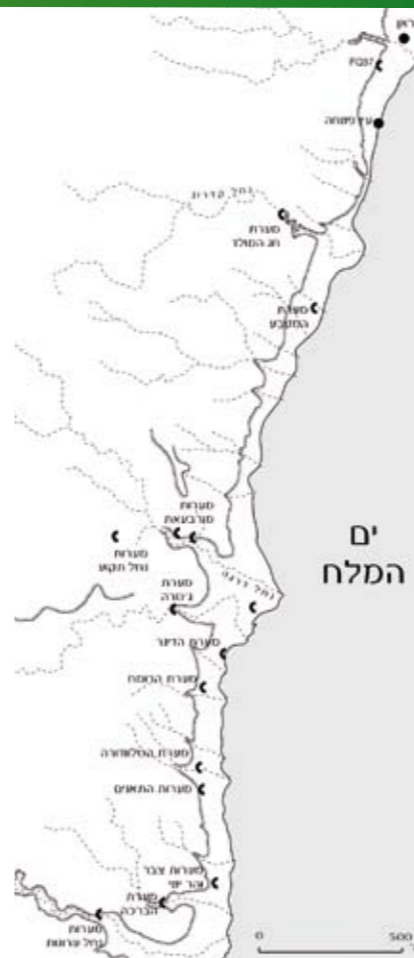
מפת המערות. איור: עמוס פרומקין