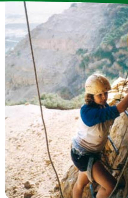
הטיפוס למערת הר ישי.

בתקווה מהולה בהנמכת ציפיות חזרנו לחפירה מלאה של מערת הר ישי. יומיים של עבודה מפרכת הניבו עוד ועוד ממצאים - שישה ראשי חץ נוספים, עוד מטבע מימי