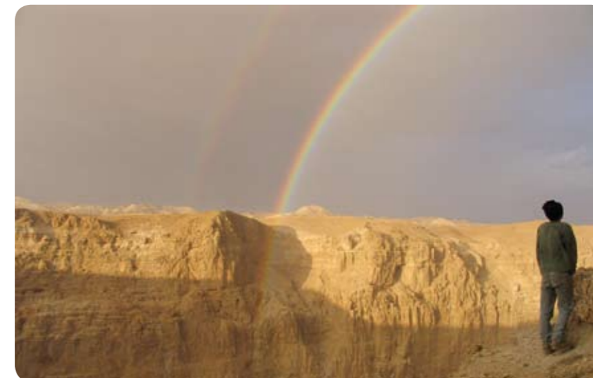
תצפית על נוף מדבר יהודה בנחל ערוגות.