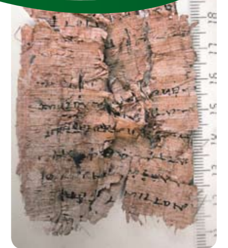
פפירוס כתוב ביוונית.