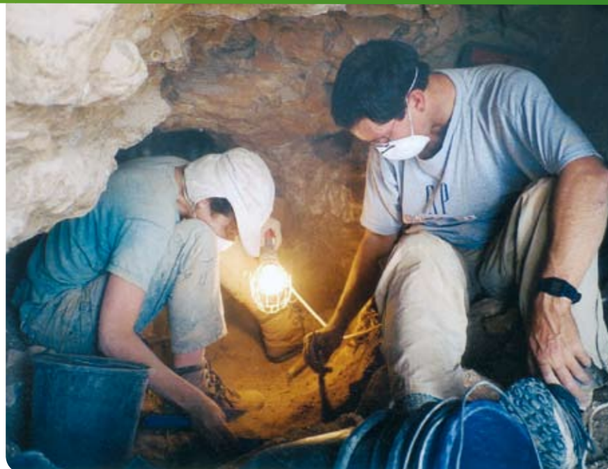
החפירות במערת הר ישי.